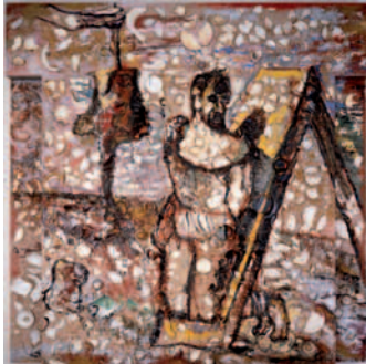
The Red Sky , 1984 Óleo, platos, masilla de relleno sobre madera Colección privada