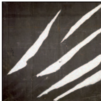
Untitled (Treatise on Melancholia) , 1989 Óleo, yeso sobre lona impermeable Colección del artista