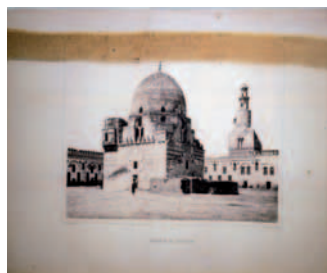
Flaubert's Letters to His Mother , 2005 Tinta sobre poliéster Colección del artista