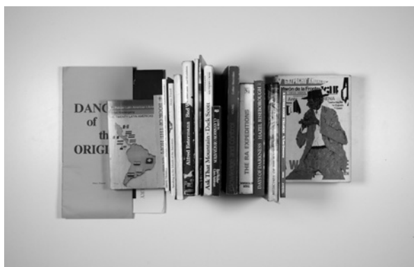
BOX 42: 2018_10_30_40