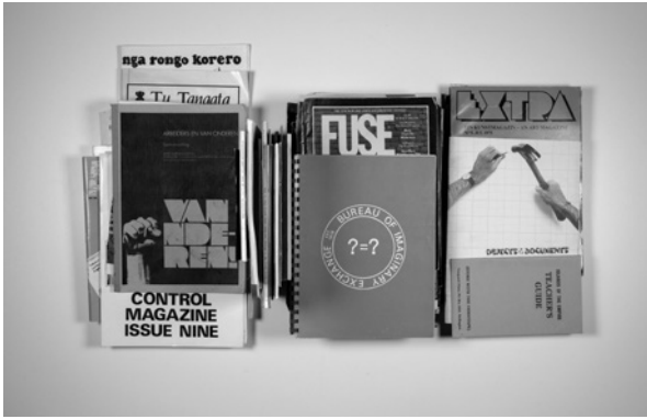
BOX 30: 2018_10_30_32