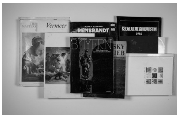
BOX 43: 2018_10_30_36

DLA/000516: Auckland City Art Gallery; A Centennial History Published by Auckland City Art Gallery, Auckland; 1988 edition