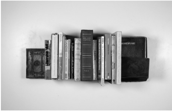
BOX 40: 2018_10_30_40