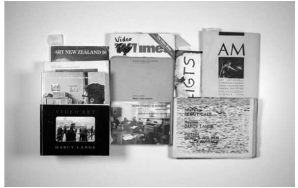
BOX 28: 2018_10_30_30