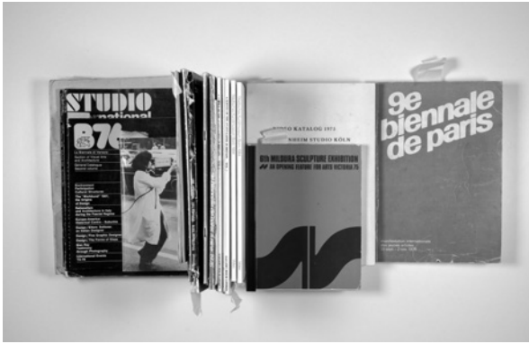
BOX 27: 2018_10_30_23