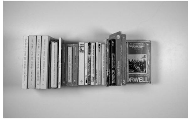
BOX 41: 2018_10_30_52

DLA/000454: Political Leaders of the Twentieth Century; Lenin - published by Penguin Books 2nd paperback edition 1969 DLA/000455: Working; People talk about what they do all day and how they feel about what they do by Studs Terkel; Avon Books New York; 1974 Paperback edition DLA/000456: The Baha'i Faith; an introduction by Gloria Faizi; Paperback DLA/000457: The Little Oxford Dictionary; 1955 edition DLA/000458: The Hidden Words by Baha'u'llah; published by Baha'i Publishing Trust London 1966 paperback edition DLA/000459: Celebration of Awareness - A Call for Institutional Revolution by Ivan Illich; Published by Penguin Books, London. 1977 paperback edition DLA/000460: The World Order of Baha'u'llah by Shoghi Effendi; published by Baha'i Publishing Trust Illinois; 1965 paperback edition