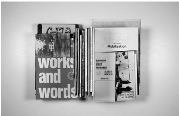
BOX 29: 2018_10_30_45